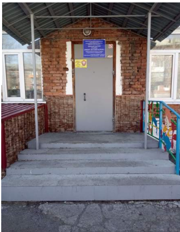
Фото № 3 Ступеньки у центрального входа