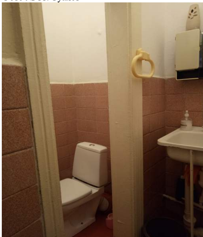
Фото № 11. Туалет