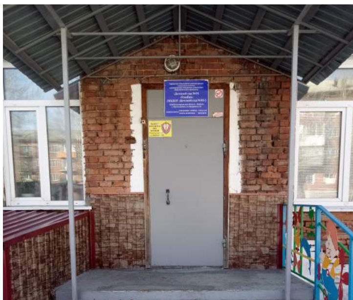
Фото № 5. Входная площадка перед дверью