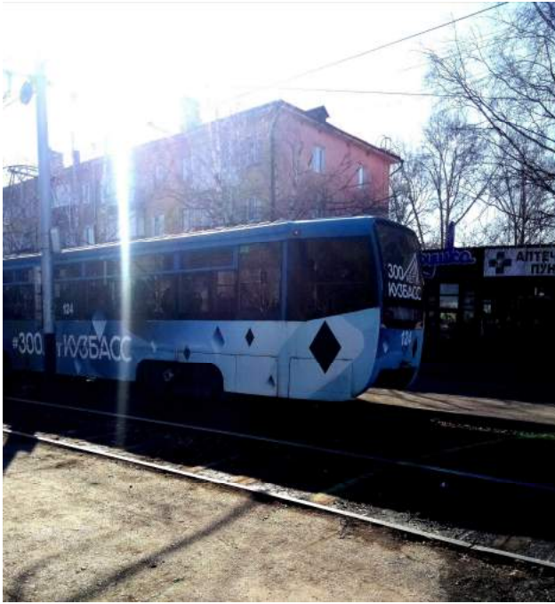
Фото №12-14. Пути движения к объекту