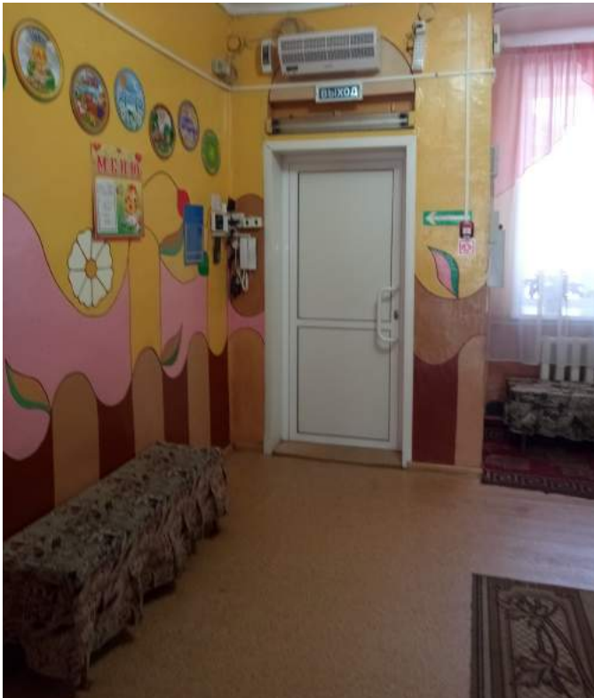
Фото № 7. Коридор