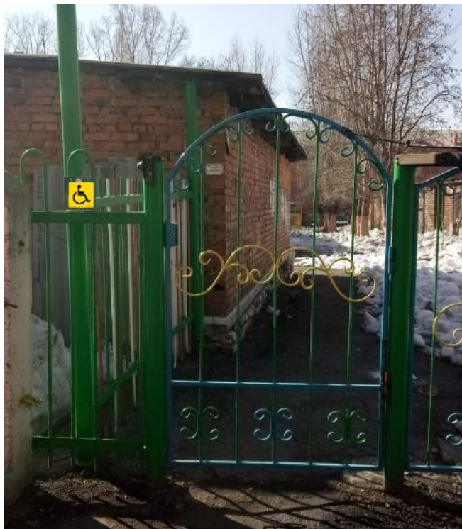
Фото № 1. Вход на территорию