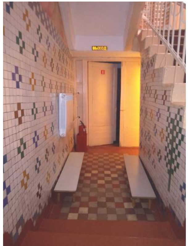
Фото № 8. Лестница внутри здания