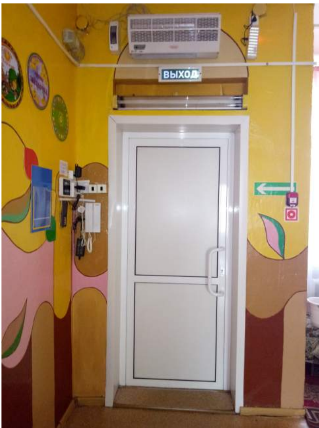
Фото № 9. Дверь